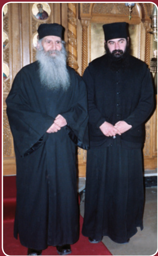
Ὁ Ὅσιος Ἰάκωβος μαζί με τὸν Πανιερώτατο Μητροπολίτη μας κατὰ τὸ ἔτος 1989.